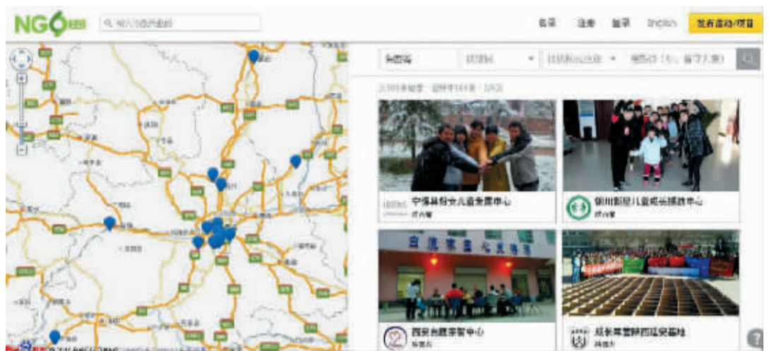
深圳市图鸥公益事业发展中心的公益地图可以按省进行查找,同时还可以进行关键词搜索

2015 年 3 月 17 日,佛山市 2015 年“岭南社工宣传周”系列活动启动。当天,佛山市社会组织电子地图(即公益地图)也正式上线。据了解,该公益地图是佛山市社会组织培育发展中心在佛山社会组织论坛的基础上研发制作,目的是为准确掌握佛